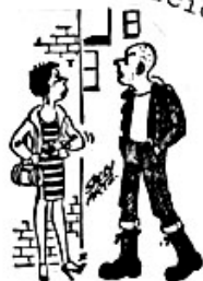
"Course I'm late— takes me two hours to shave, dunnit!"