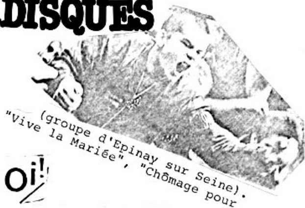
(groupe d'Epinaay sur Seine). "vive la Mariée", "Chômage pour

Le 45 t. d'INFANTRIE SAUVAGE Du oi sauvage et mélodieux - Bord de Seine, Diskolocaust, boire). Ce Ep est le numéro 3